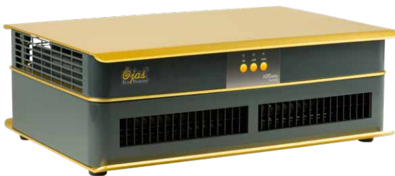
AERSwiss Pro Gold