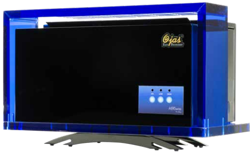
AERSwiss Pro Blue